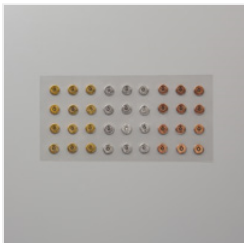
Designer Elements - 149586