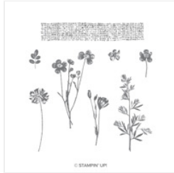
Pressed Flowers Clear-Mount Stamp Set - 146789