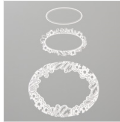
Petal Labels Dies - 149635