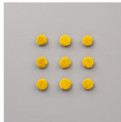
Perennial Essence Floral Centers - 149442