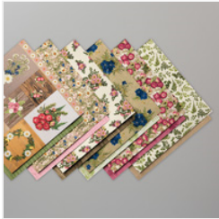
Pressed Petals Specialty Designer Series Paper - 149500