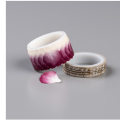
Pressed Petals Specialty Washi Tape - 149585