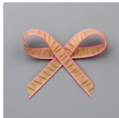
Rococo Rose 1/2" (1.3 Cm) Gathered Ribbon - 149587