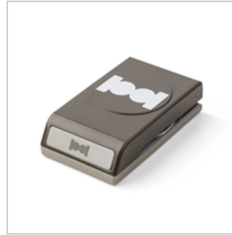
Circle Tab Punch