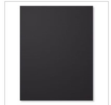
Basic Black A4 Cardstock