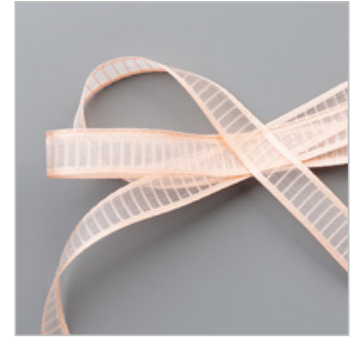
Petal Pink 5/8" (1.6 Cm) Organdy Striped Ribbon