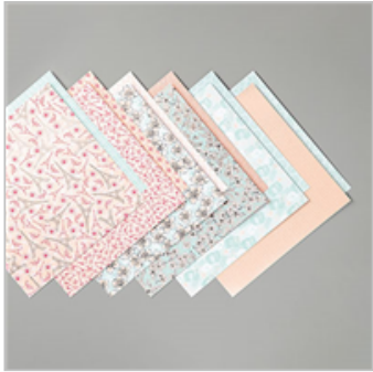
Parisian Blossoms Specialty Designer Series Paper