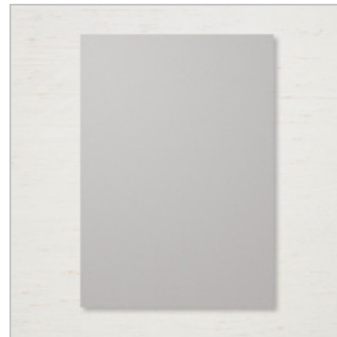
Gray Granite A4 Cardstock