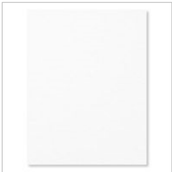
Whisper White A4 Cardstock