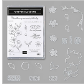
Forever Blossoms Bundle (English)